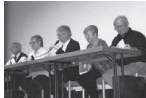
Das Präsidium des BSB