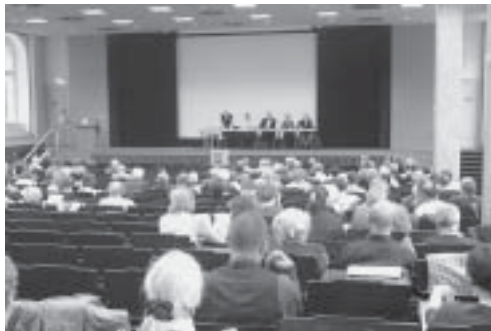
Blick in das Auditorium