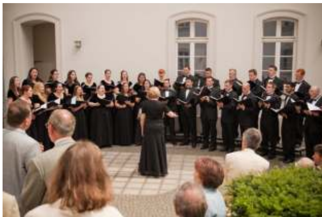
Der Gastchor Worcester University Chorale aus den USA