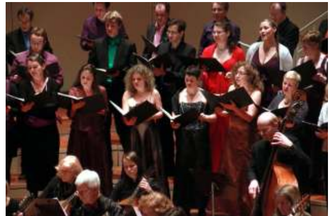
Gemeinsamer Auftritt von tea-cream-singers, Inspired! und Zupforchester Berlin